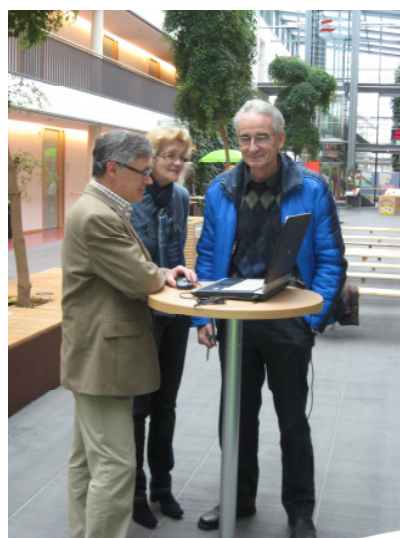
Beratung durch die ELSTER-Experten