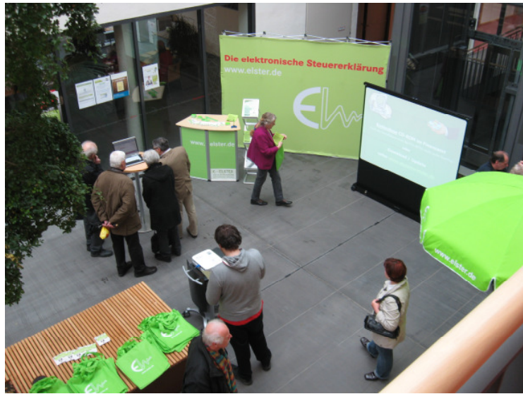
Besucher des Informationstages