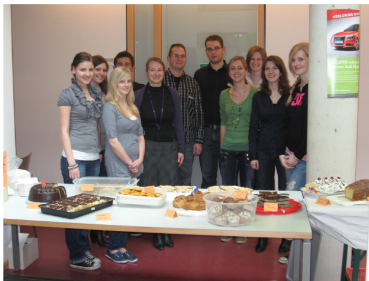
Das freundliche Auszubildendenteam sorgte für die Bewirtung