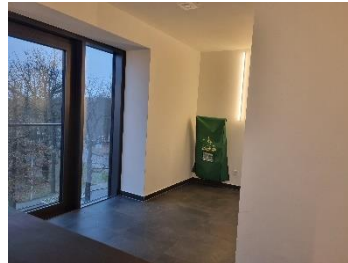
4. OG Treppenhaus TR 02 vor Aufzug.