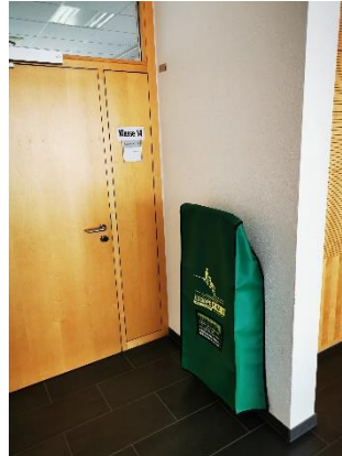
1. OG vor Lehrsaal 28