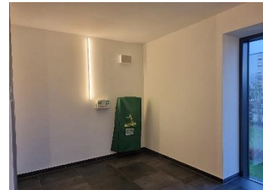
2. OG Treppenhaus TR 03 vor Aufzug.