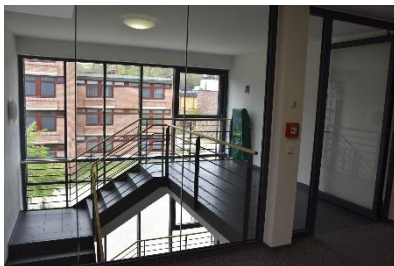
2. OG Haupttreppenhaus Flureingang vor Aufzug.