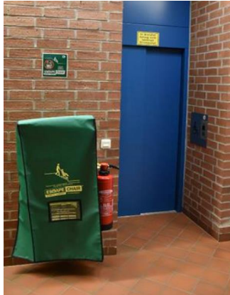
3. OG zwischen Aufzug und Herrentoilette.