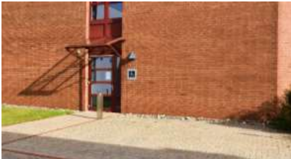
2 der 4 vorhandenen barrierefreien Parkflächen im Umfeld des Gästehauses 1

Die Mehrzahl der Stellplätze (10) befindet sich in direkter Nähe zu den Gästehäusern 1 und 3 .