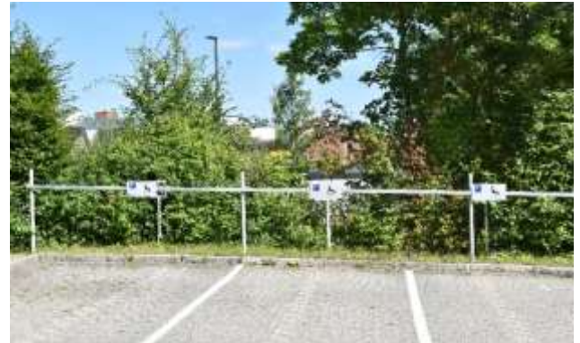
3 der 6 vorhandenen barrierefreien Parkflächen auf Parkebene 1 des Hauptparkplatzes

Auch wenn diese etwas weniger zentral gelegen sind, gibt es eine Vielzahl an barrierefreien Wegen, um von dort aus sowohl zum Zentral- und Kombigebäude als auch über das anschließende Innenhofwegesystem zu den Gästehäusern 1 bis 3 zu gelangen.