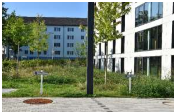
Barrierefreie Parkflächen am Gästehaus 4

Darüber hinaus befinden sich direkt am Gästehaus 4 zwei weitere barrierefreie Parkplätze.