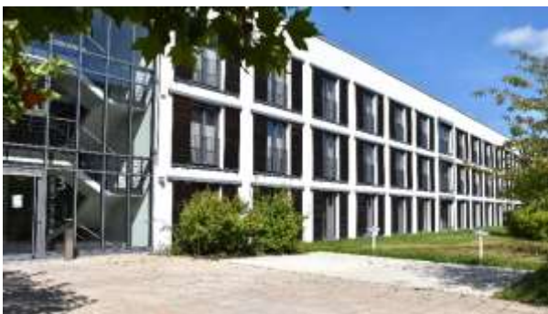
2 der 4 barrierefreien Parkplätze im Bereich des Gästehauses 3

In den Erdgeschossen befinden sich vier (Gästehaus 1) bzw. zwölf (Gästehaus 3) barrierefreie Apartments. Menschen mit körperlichen Einschränkungen können somit während der Teilnahme an Aus- und Fortbildungsveranstaltungen eines dieser barrierefreien Apartments nutzen und ortsnah parken.