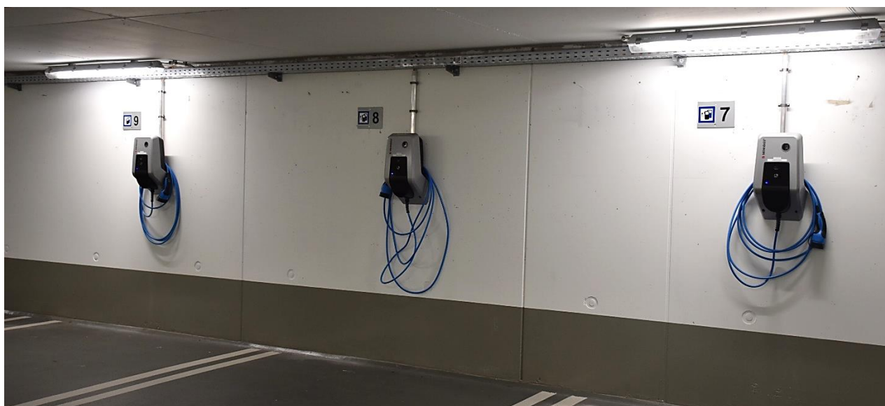
3 der 13 vorhandenen Ladestationen in der Tiefgarage des Gästehauses 4

Die Landesfinanzschule Bayern verfügt am Stammsitz in Ansbach über 13 hauseigene Ladestationen für Elektro- und Hybridfahrzeuge. Diese befinden sich in der Tiefgarage des Gästehauses 4 .