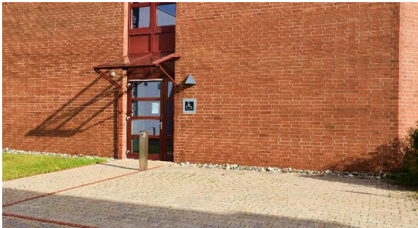
2 der 4 vorhandenen barrierefreien Parkflächen im Umfeld des Gästehauses 1

Die Mehrzahl der Stellplätze (10) befindet sich in direkter Nähe zu den Gästehäusern 1 und 3 .