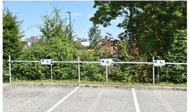
3 der 6 vorhandenen barrierefreien Parkflächen auf Parkebene 1 des Hauptparkplatzes

Auch wenn diese etwas weniger zentral gelegen sind, gibt es eine Vielzahl an barrierefreien Wegen, um von dort aus sowohl zum Zentral- und Kombigebäude als auch über das anschließende Innenhofwegesystem zu den Gästehäusern 1 bis 3 zu gelangen.