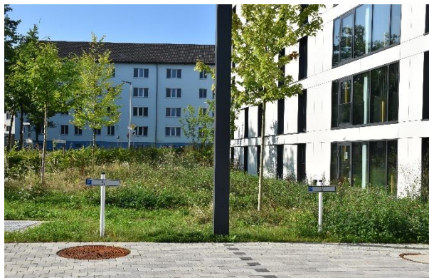
Barrierefreie Parkflächen am Gästehaus 4

Darüber hinaus befinden sich direkt am Gästehaus 4 zwei weitere barrierefreie Parkplätze.