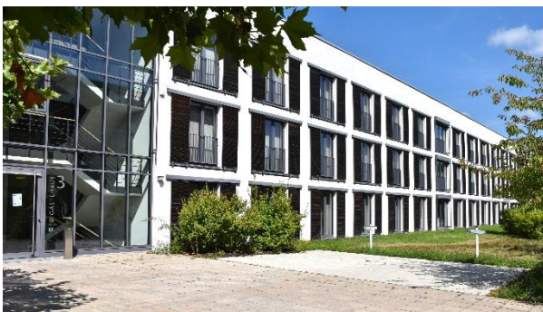
2 der 4 barrierefreien Parkplätze im Bereich des Gästehauses 3

In den Erdgeschossen befinden sich vier (Gästehaus 1) bzw. zwölf (Gästehaus 3) barrierefreie Apartments. Menschen mit körperlichen Einschränkungen können somit während der Teilnahme an Aus- und Fortbildungsveranstaltungen eines dieser barrierefreien Apartments nutzen und ortsnah parken.