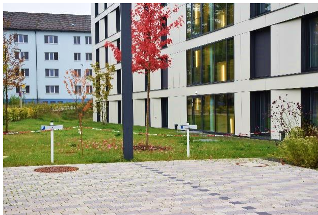
Barrierefreie Parkflächen am Gästehaus 4

Darüber hinaus befinden sich direkt am Gästehaus 4 zwei weitere barrierefreie Parkplätze.