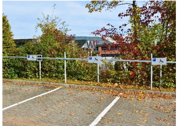
3 der 6 vorhandenen barrierefreien Parkflächen auf Parkebene 1 des Hauptparkplatzes

Auch wenn diese etwas weniger zentral gelegen sind, gibt es eine Vielzahl an barrierefreien Wegen, um von dort aus sowohl zum Zentral- und Kombigebäude als auch über das anschließende Innenhofwegesystem zu den Gästehäusern 1 bis 3 zu gelangen.