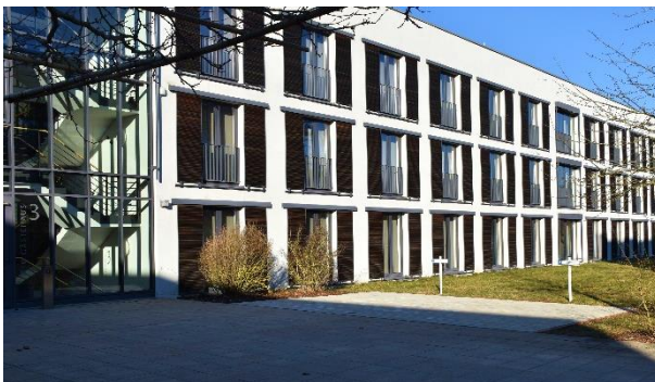
2 der 4 barrierefreien Parkplätze im Bereich des Gästehauses 3

In den Erdgeschossen befinden sich vier (Gästehaus 1) bzw. zwölf (Gästehaus 3) barrierefreie Apartments. Menschen mit körperlichen Einschränkungen können somit während der Teilnahme an Aus- und Fortbildungsveranstaltungen eines dieser barrierefreien Apartments nutzen und ortsnah parken.