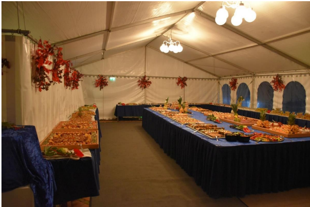
Hier ein Blick auf die kulinarischen Köstlichkeiten des Festbuffets von der Firma Wisag Catering