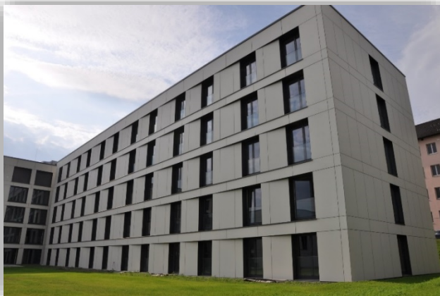
Das neue Gästehaus 4 mit 270 Einzelappartements

Ausführliche Informationen zu den Neubauten auf dem Finanzcampus der Landesfinanzschule Bayern folgen in Kürze durch einen gesonderten lfsTicker!