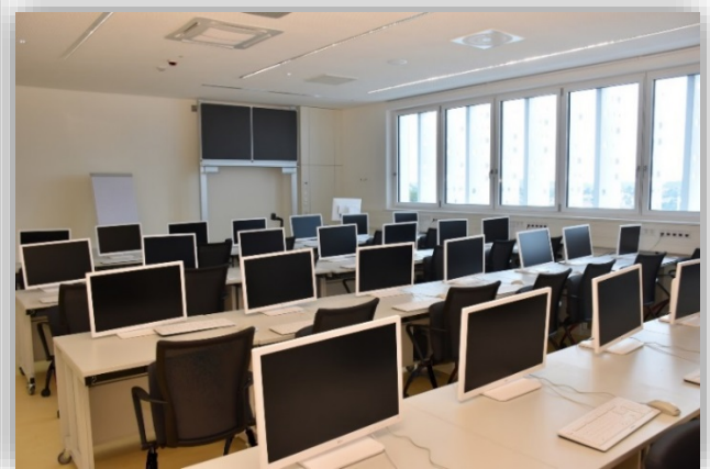
Blick in einen der 11 Lehrsäle mit je 28 EDV-Arbeitsplätzen

+ lfsTicker + + + lfsTicker + + + lfsTicker + + + lfsTicker + + + lfsTicker + + + lfsTicker + + + lfsTicker + + +