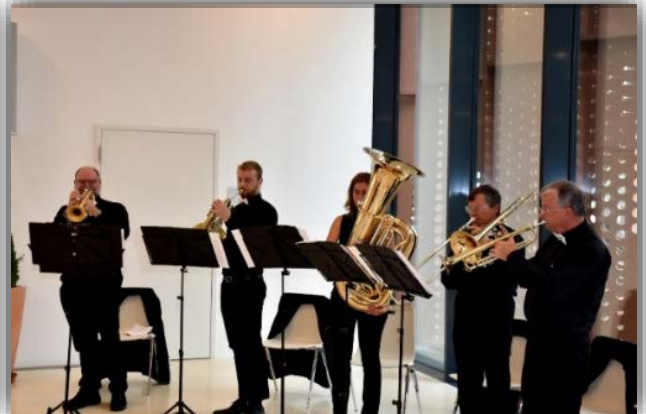
Festakteröffnung durch das Ensemble „Onoldia-Brass“ aus Ansbach mit "Rondeau" - von Jean Joseph Mouret