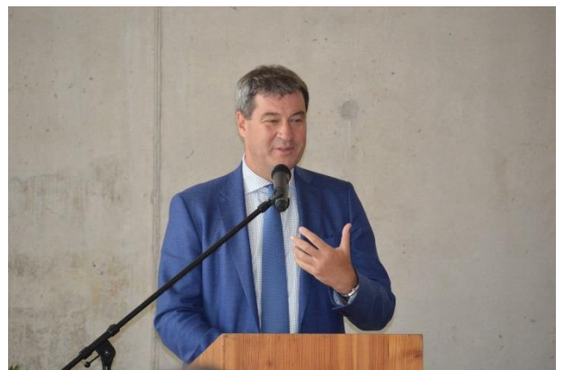
Dr. Markus Söder, Bayerischer Staatsminister der Finanzen, für Landesentwicklung und Heimat, bei seiner Festrede