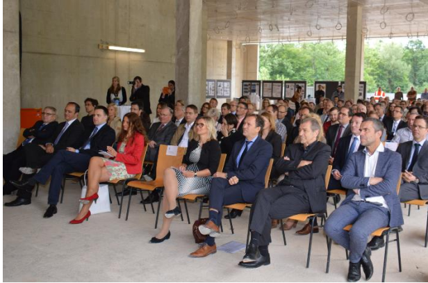
Blick in das Auditorium