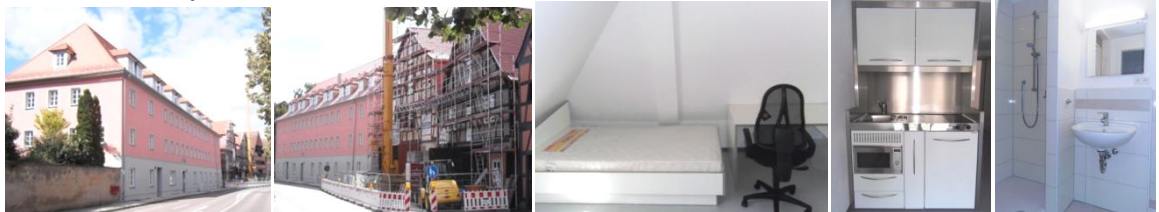
Appartements Würzburger- (links) und Hospitalstr (ingerüstet) Bett und Schreibtisch (Beispiel) Küchenzeile und Naßzelle (Beispiel)