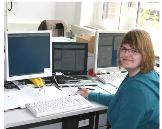
Anwärtlerin mit Laptop für Schriftdolmetschung

Nach einer eingehenden Informationsveranstaltung für Dozenten und Klasse - unter Beteiligung der Spezialfirma, des mobilen sonderpädagogischen Dienstes und der Bezirksvertrauensperson der schwerbehinderten Menschen Erwin Riedel - wird die Technik nunmehr bereits seit Wochen problemlos im Unterrichtsalltag eingesetzt. Klasse und Dozenten bestätigen sogar eine Verbesserung der Gesprächsdisziplin durch den Einsatz von Mikrofonen.