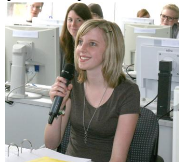
„Anwärttermikrofon“ im Unterrichtseinsatz

Die Landesfinanzschule Bayern bedankt sich bei den Dozenten und der Klassengemeinschaft für die vorbehaltlose Unterstützung bei der technischen Umsetzung!