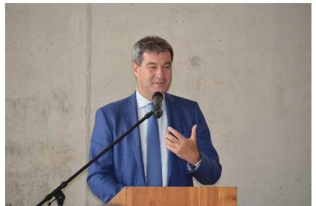
Dr. Markus Söder, Bayerischer Staatsminister der Finanzen, für Landesentwicklung und Heimat, bei seiner Festrede